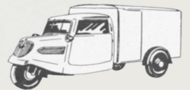
TEMPO HANSEAT KASTENWAGEN RADSTAND 2.870 MM