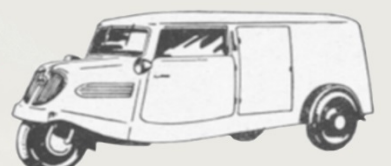
TEMPO HANSEAT KASTENWAGEN RADSTAND 2.870 MM